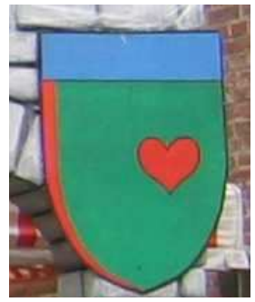
20 Wappen auf Sperrholz gemalt, ca. 70cm hoch