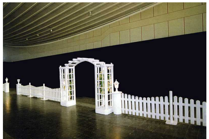
2.030 Säule 2.031 Säule mit Lampe