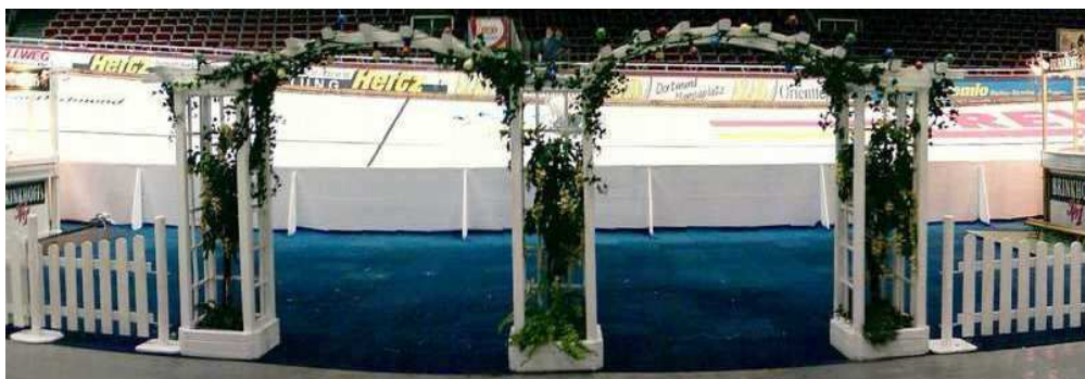
2.033 als Doppelpergole